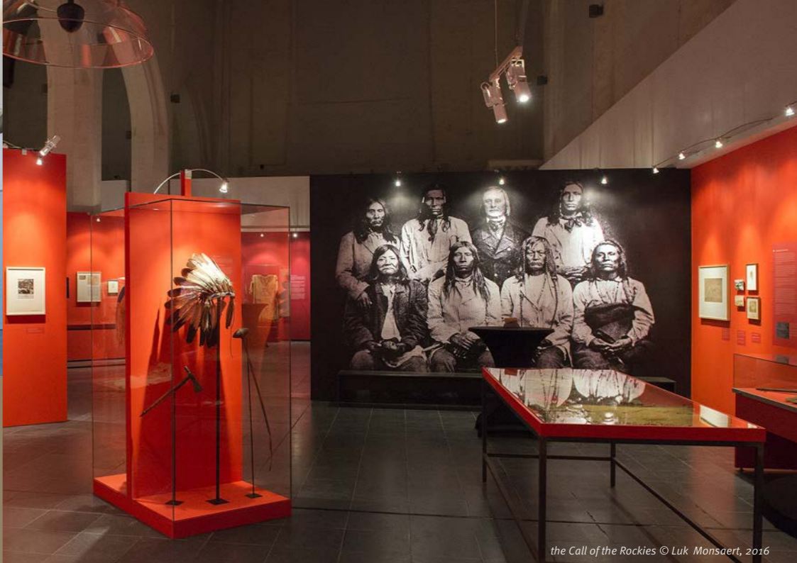
the Call of the Rockies