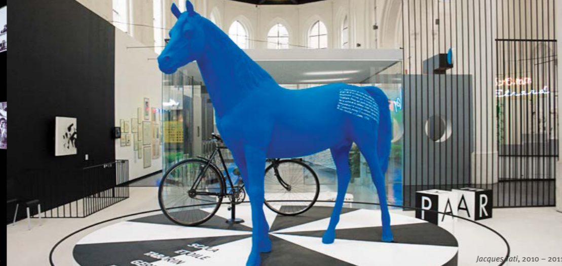
Jacques Tati, 2010 – 2011