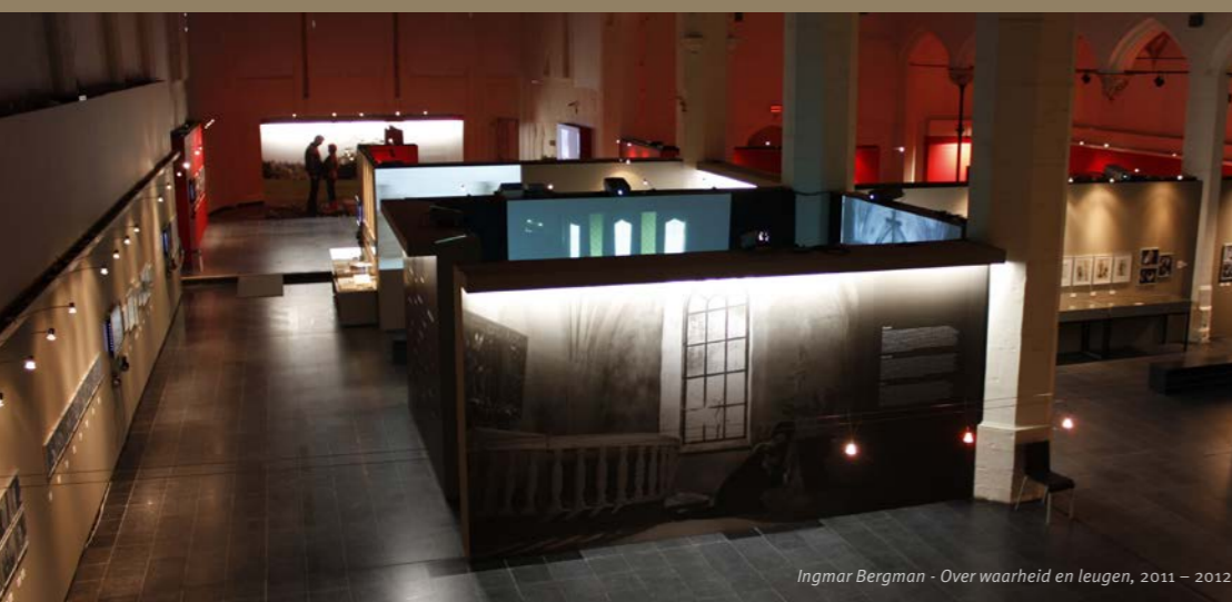
Ingmar Bergman - Over waarheid en leugen, 2011 – 2012