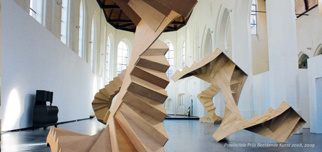
Provinciale Prijs Beeldende Kunst 2008, 2009