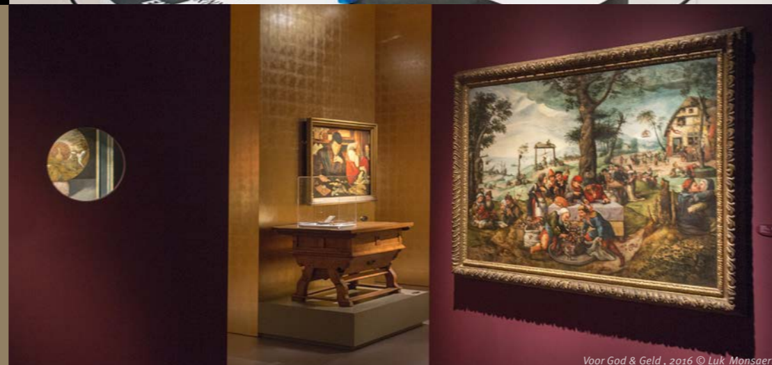
Voor God & Geld, 2016 © Luk Monsaert

Aujourd'hui, le couvent reçoit de nombreux visiteurs différents. Grâce à son identité unique dans le paysage culturel, le Caermersklooster a une importance au niveau flamand, national et même international.