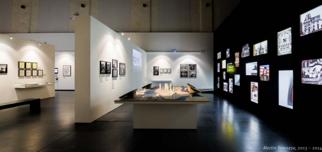
Martin Scorsese, 2013 – 2014